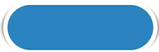
CELESTE N° 07