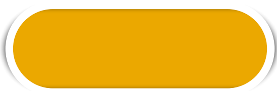
AM. OURO N° 01