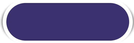
ROXO N° 17