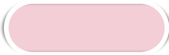
ROSA N° 30