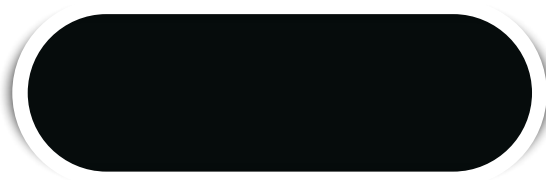
PRETO N° 12