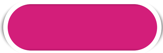
PINK N° 11