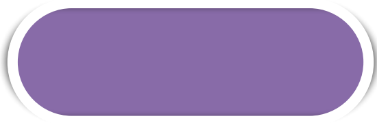
LILÁS N° 109