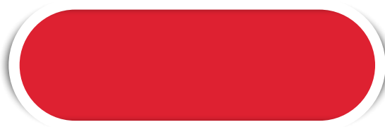
VERMELHO N° 14