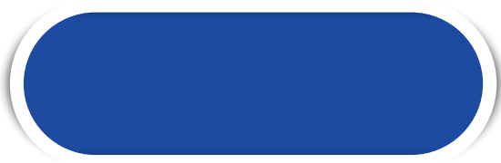
ROIAL N° 13