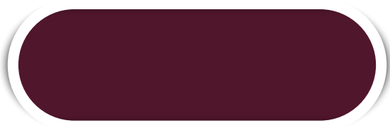
VINHO N° 15