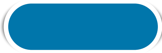
TURQUESA N° 133