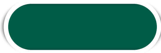
VD. BANDEIRA N° 16