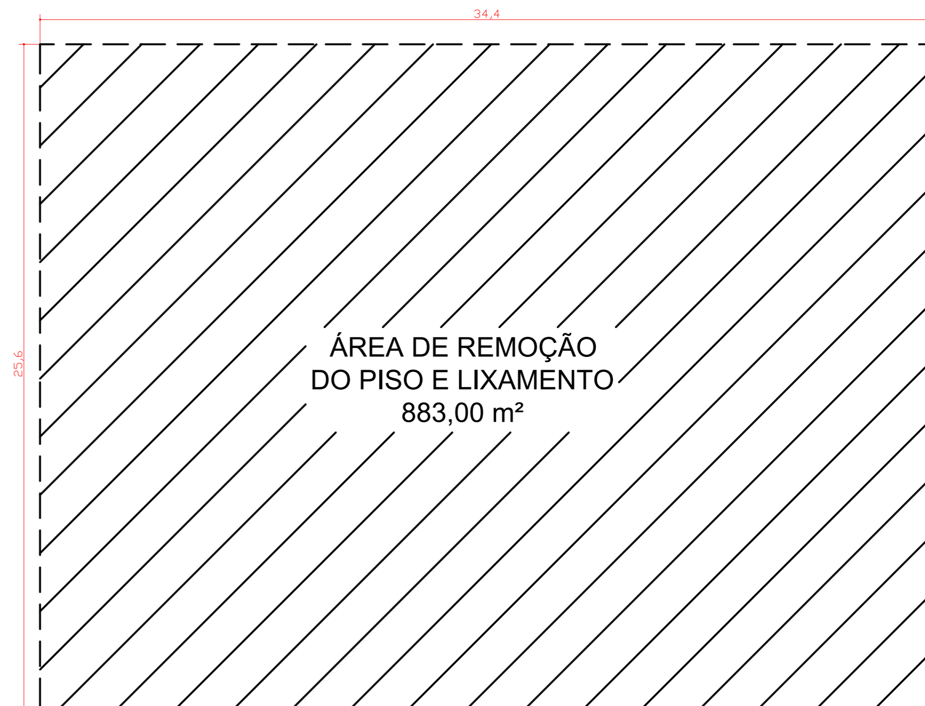
2 ÁREA DA MODIFICAÇÃO DO PISO 1:150