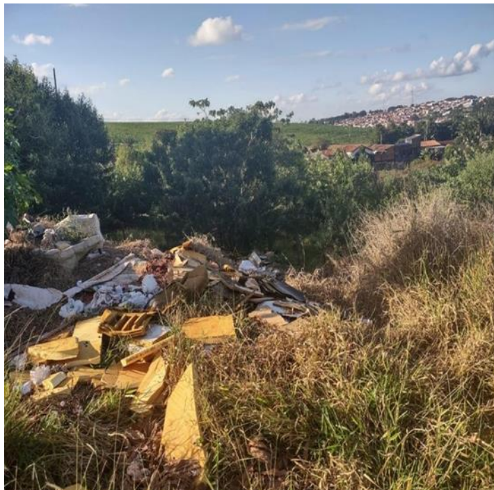
Figura 2. Vista atual da área em 2023. Degradação por depósito irregular de lixo e degradação.